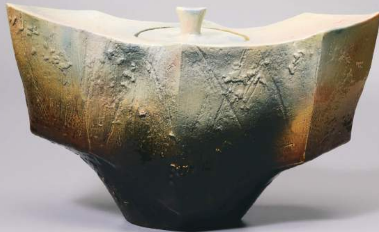
24 大樋窯変祭器「尊崇」 36.9cmW×16.2cmD×21.3cmH Firing-Denatured Obi Ceremonial vessel 'SONSU'