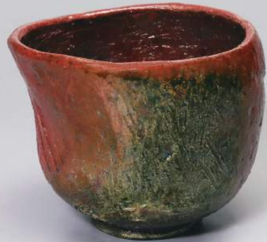
13 大樋窯変聖茶盃 11.8cmW×9.3cmH Firing-Denatured Obi Tea Bowl Hijiri Style