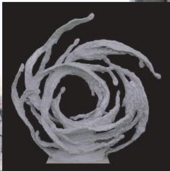
3 The circle of transmigration 2024 71.5cmH×75cmD×20cmW 粘土で制作した原型からの金属作品（制作過程） Metal work from prototype made of clay (Production process)