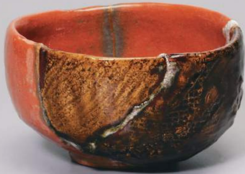
2 大樋転生茶盃 14.2cmW×7.8cmH Ohi Tea Bowl Reborn 9+10+11