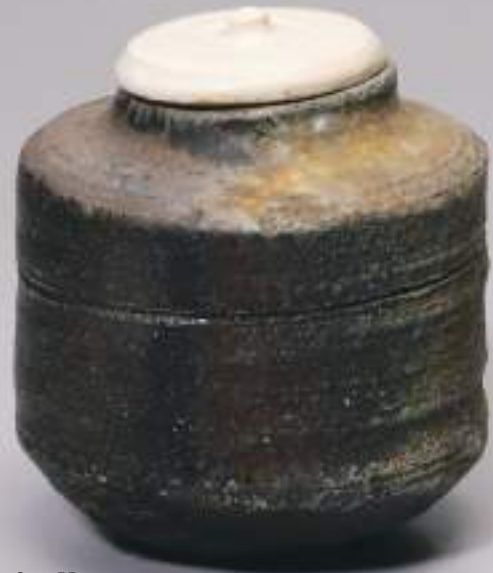
16 大樋越前茶入 7.5cmW×8.6cmH Obi Echizen Tea Container