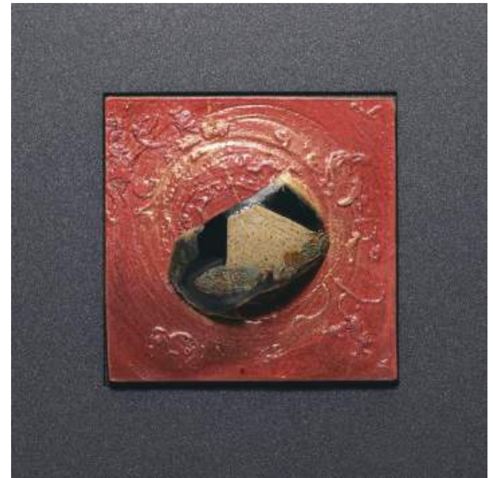
4 Clay Work Reborn 10+11 30.0cmW×30.0cmW×6.5cm