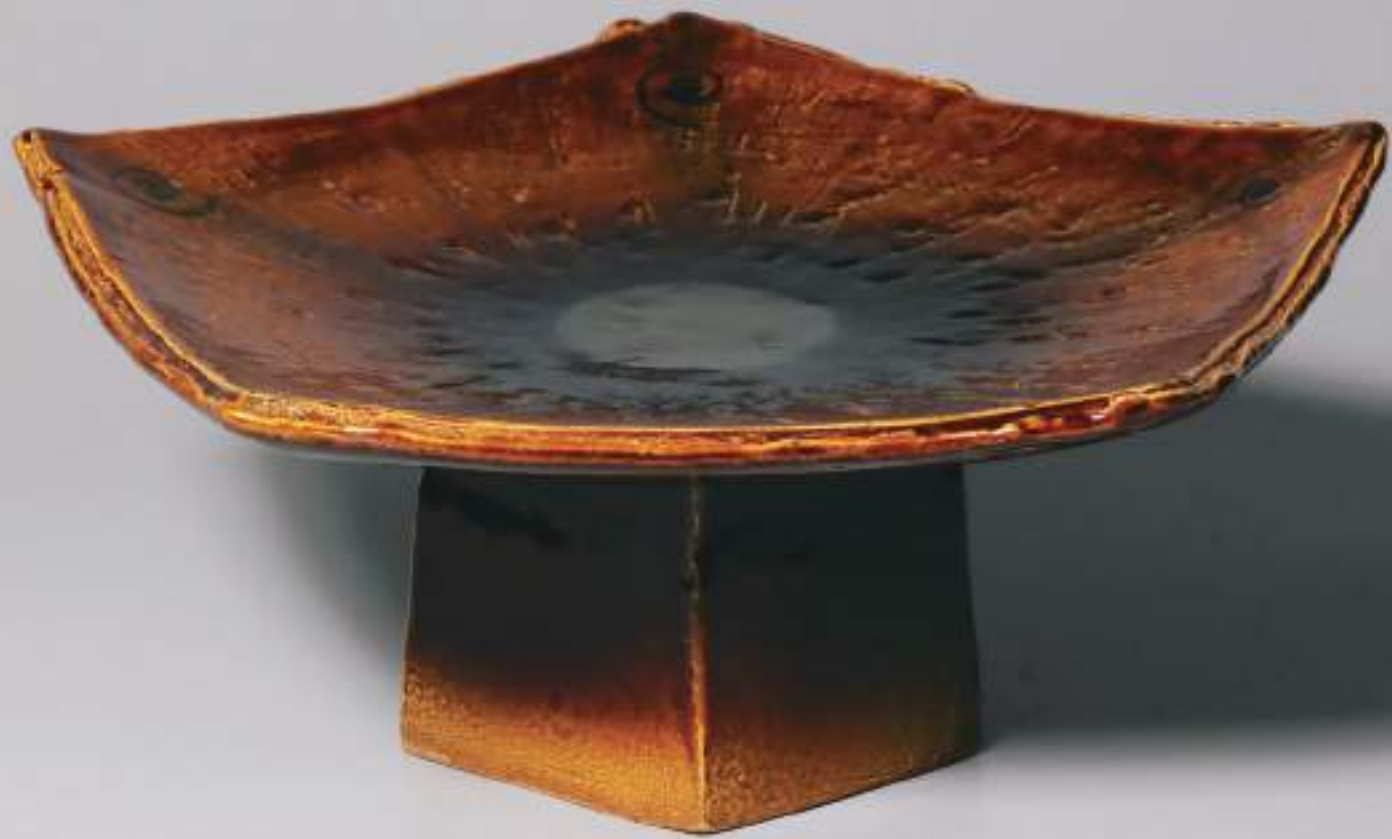
23 祈器「五芒」 34.8cmW×13.9cmH Five Elements Ceremonial Vessel