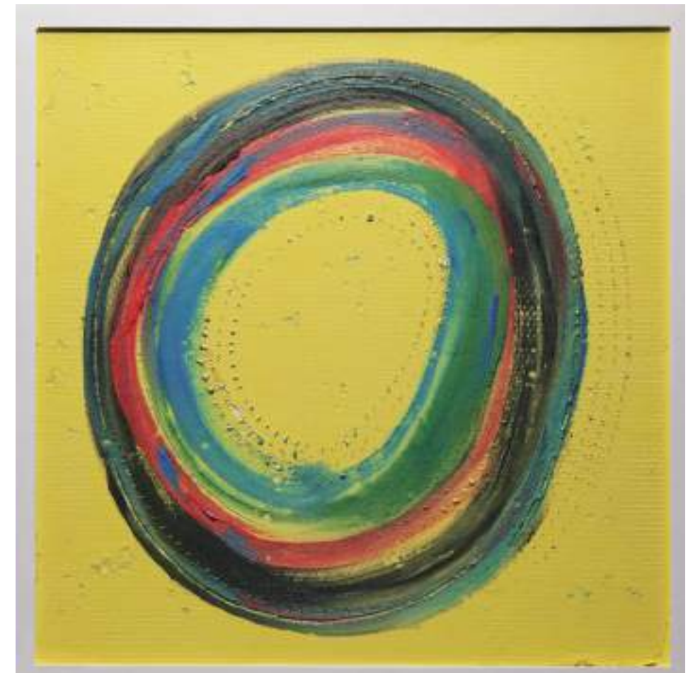
29 Circle 2023 金沢浅野川砂、能登珪藻土、大樋土、漆喰、稲穂 60.5cmW×60.5cmW×3.0cm Sand of Kanazawa Asanogawa River, Noto Diatomaceous earth, Obi Clay, Plaster and ear of rice