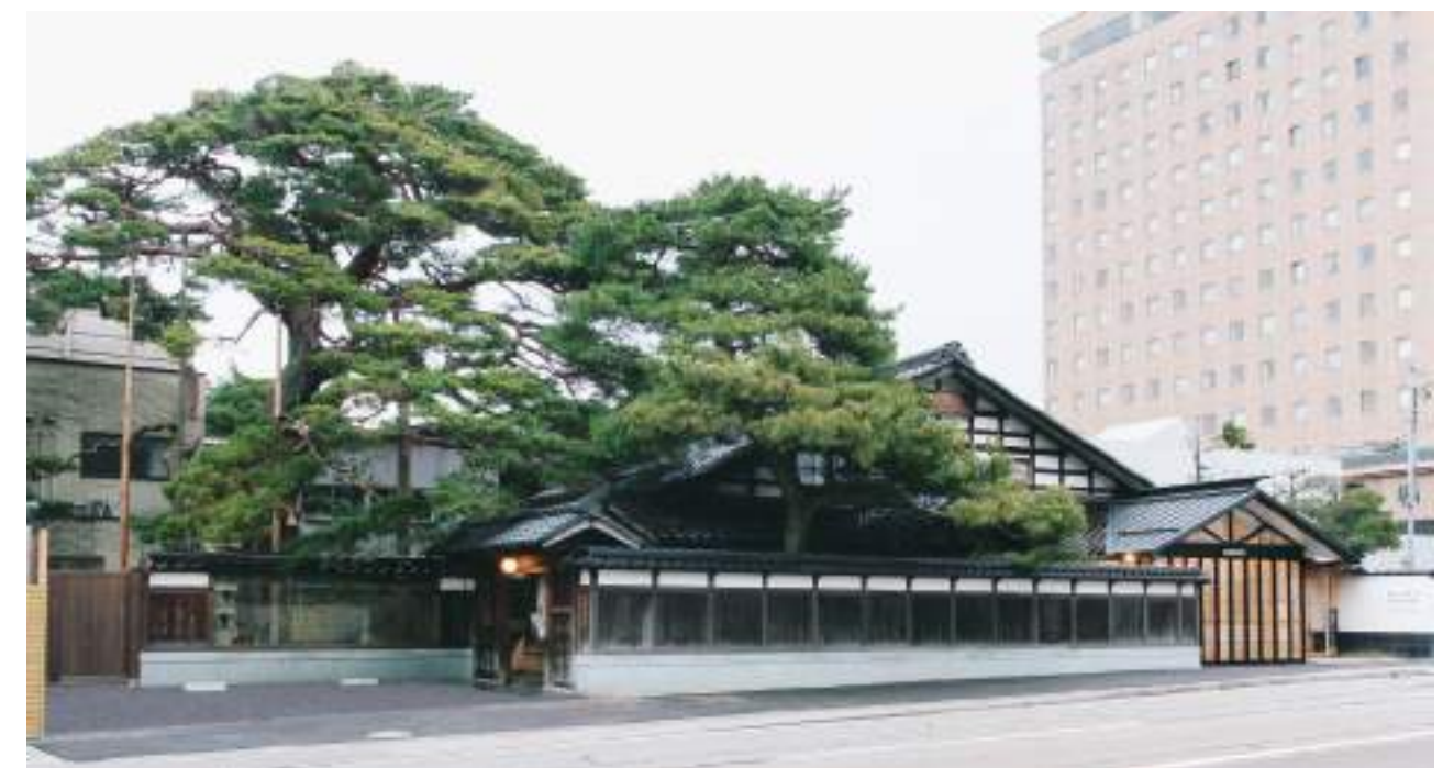
大樋長左衛門窯・大樋ギャラリー・年々庵(茶室) 建築家・隈研吾氏設計 View of the Ohi Chozaemon Ware Designed by Architect Kuma Kengo (金沢市指定建造物・Historic architectural structure by the city of Kanazawa)