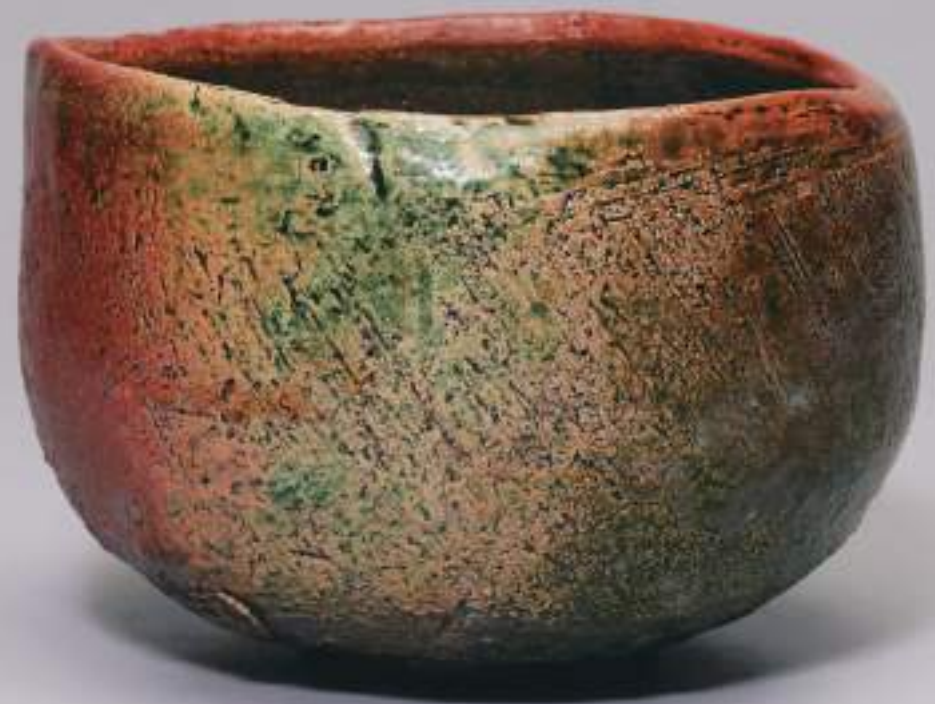
14 大樋窯変茶盃 13.2cmW×9.0cmH Firing-Denatured Obi Tea Bowl