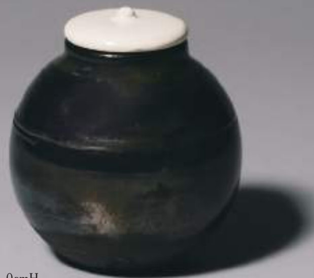
17 大樋窯変茶入 8.1cmW×9.0cmH Firing-Denatured Obi Tea Container