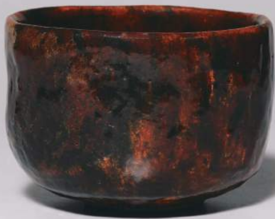
8 大樋飴釉茶盃 11.7cmW×8.7cmH Amber Ohi Tea Bowl