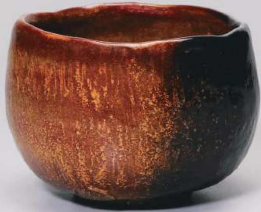
20 大樋飴釉茶盃 12.1cmW×8.5cmH Amber Ohi Tea Bowl