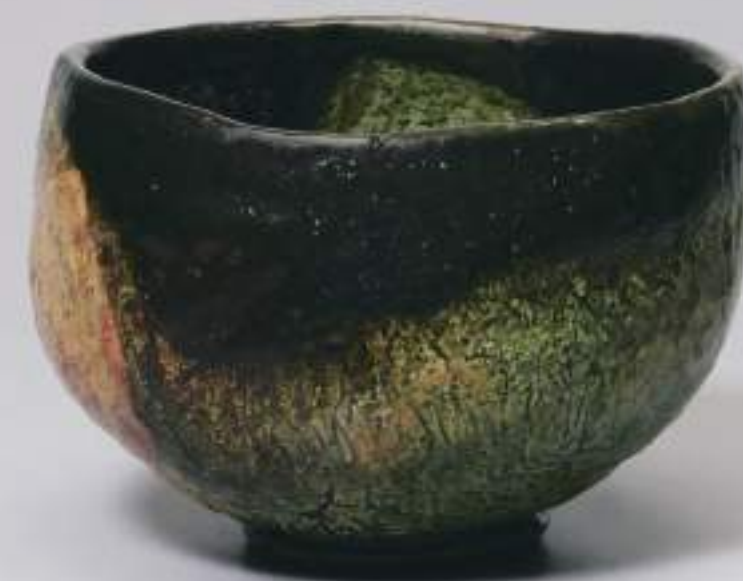
背面 (back side)