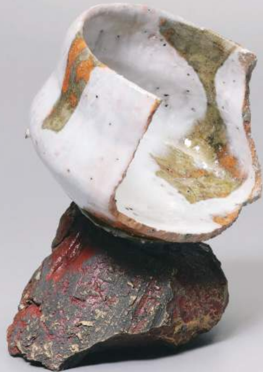
5 祈器 Reborn 10+11 12.0cmW×16.0cmH Five Elements Ceremonial Vessel Reborn 10+11