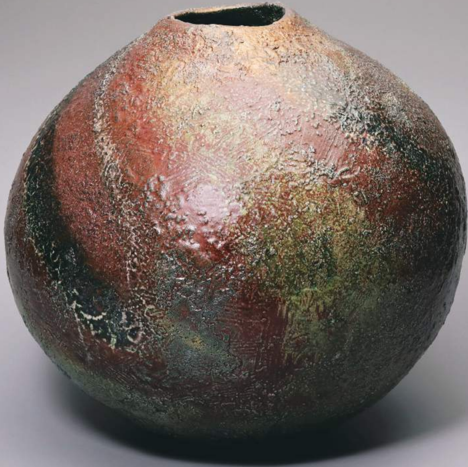
6 岩漿祭器 第61回記念日本現代工芸美術展出品作品 43.3cmW×40.3cmH Ceremonial Vessel 'Magma' Exhibited at The 61th Japan Contemporary Arts and Crafts Exhibition