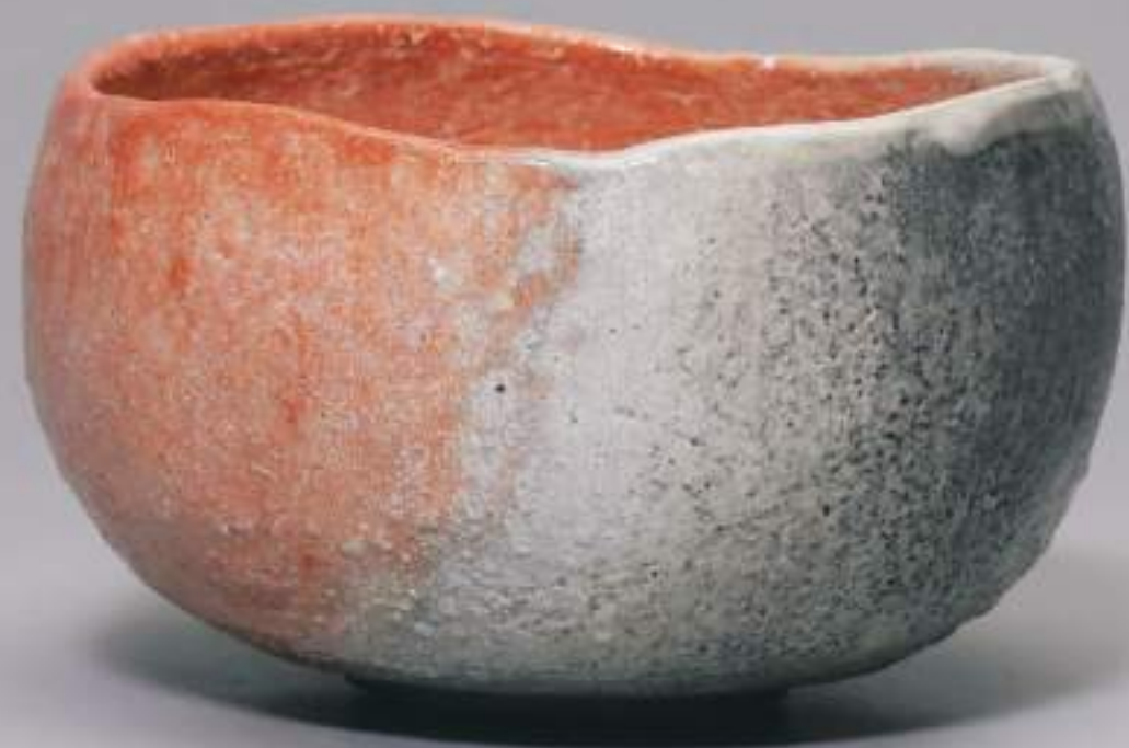
11 大樋白釉窯変茶盃 13.4cmW×8.0cmH Firing-Denatured White Ohi Tea Bowl