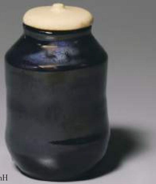
15 大樋窯変茶入 6.9cmW×11.1cmH Firing-Denatured Obi Tea Container