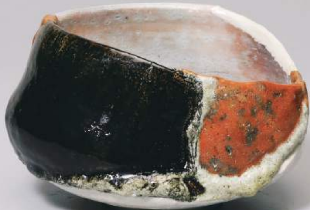
1 大樋転生茶盃 12.3cmW×8.3cmH Obi Tea Bowl Reborn 9+10+11