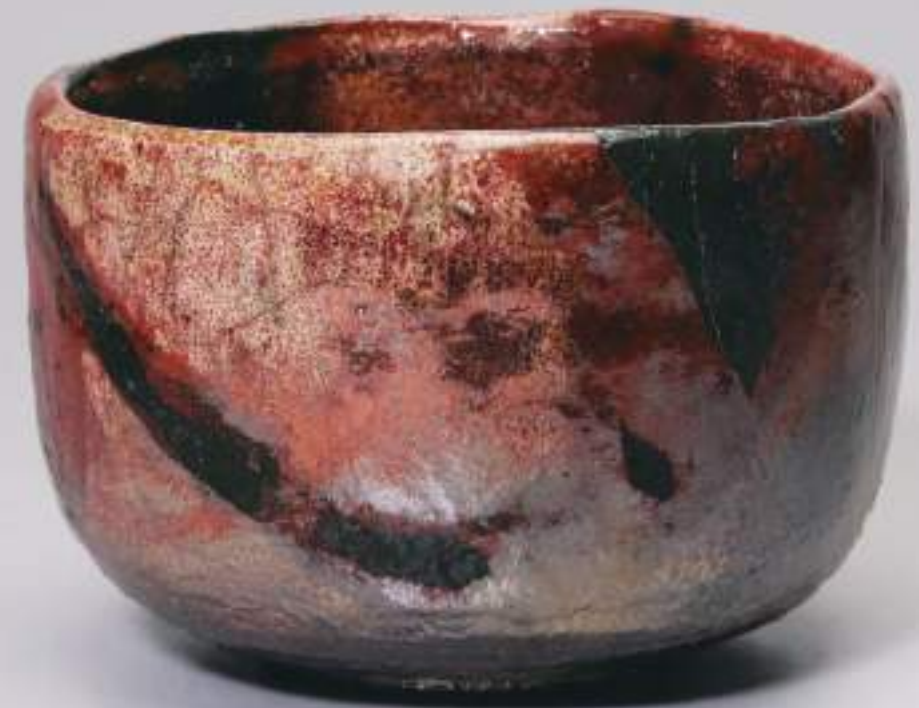
19 大樋窯変茶盃 12.3cmW×8.5cmH Firing-Denatured Ohi Tea Bowl