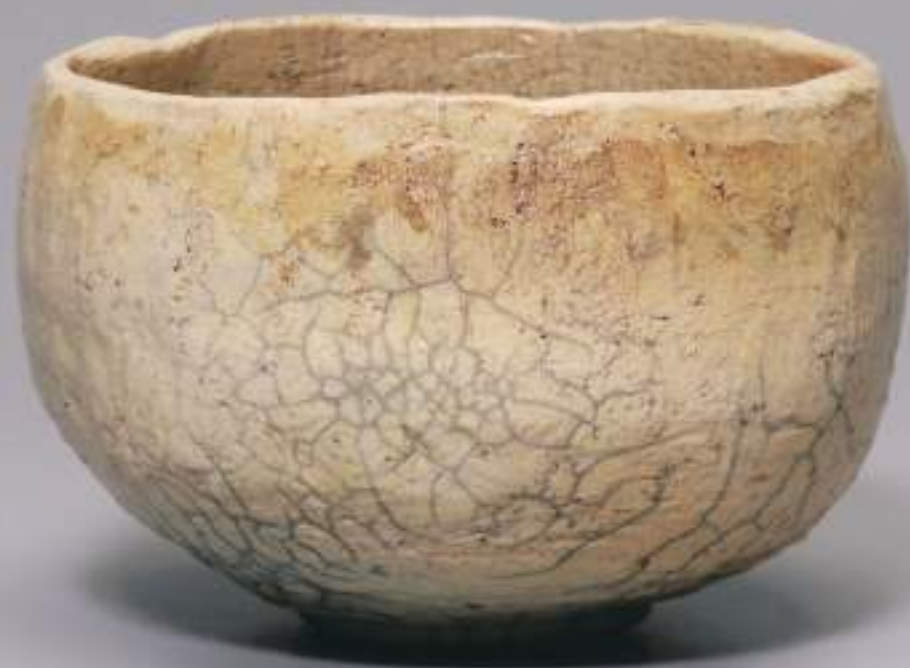
12 大樋白釉窯変茶盃 12.9cmW×8.7cmH Firing-Denatured White Ohi Tea Bowl