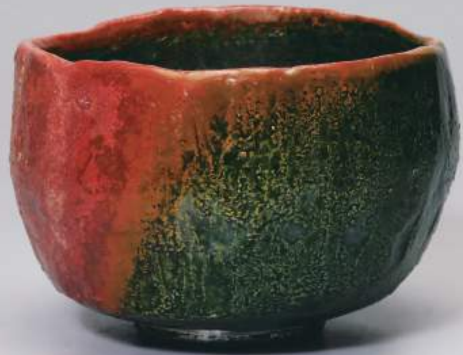
21 大樋窯変茶盃 12.1cmW×8.3cmH Firing-Denatured Ohi Tea Bowl