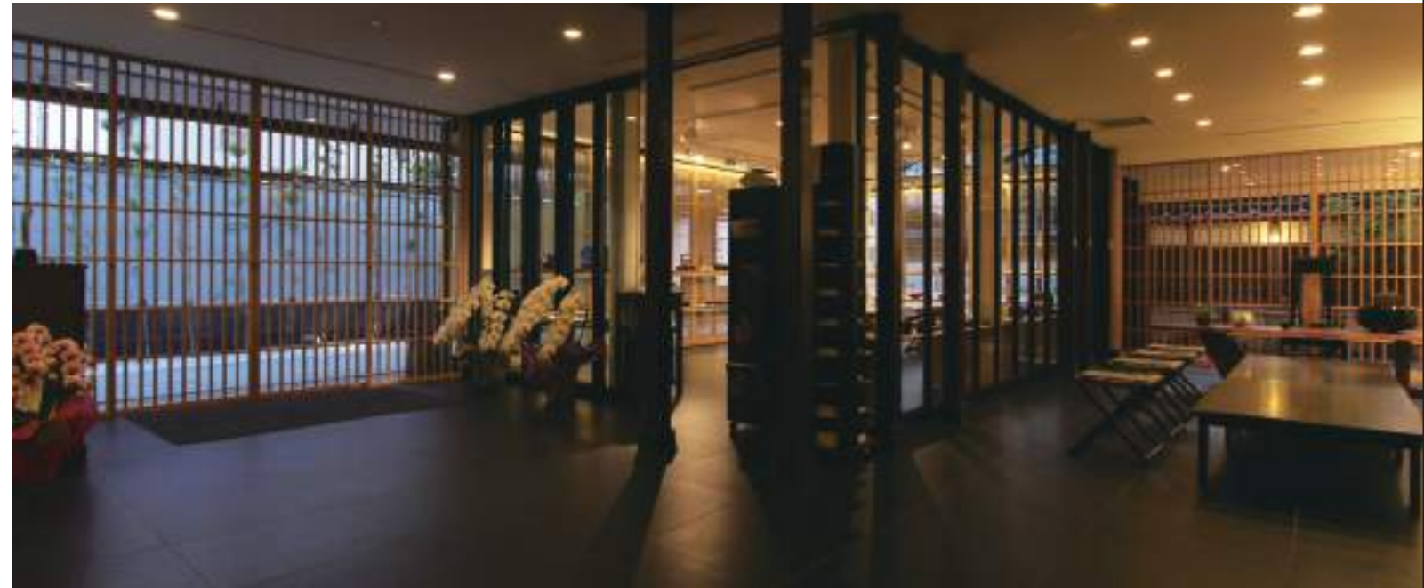
大樋長左衛門窯・大樋ギャラリー・年々庵(茶室) 建築家・隈研吾氏設計 (金沢市指定建造物・Historic architectural structure by the city of Kanazawa) View of the Ohi Chozaemon Ware Designed by Architect Kuma Kengo