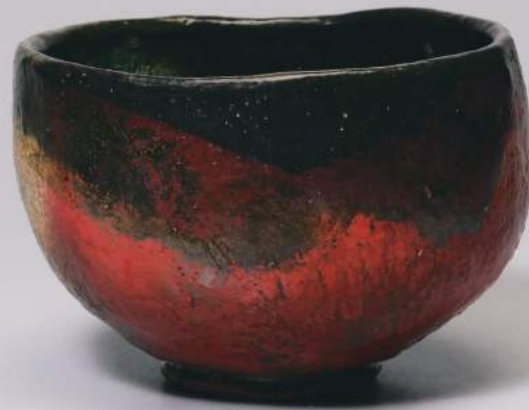
10 大樋窯変茶盃 13.0cmW×9.0cmH Firing-Denatured Ohi Tea Bowl