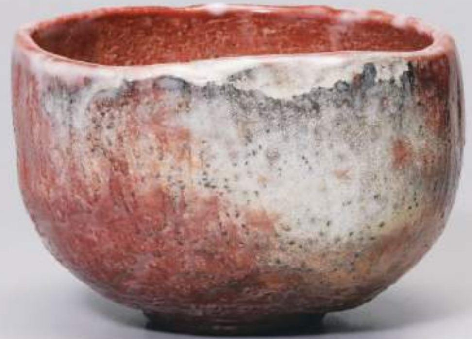
18 大樋窯変茶盃 13.0cmW×8.5cmH Firing-Denatured Ohi Tea Bowl