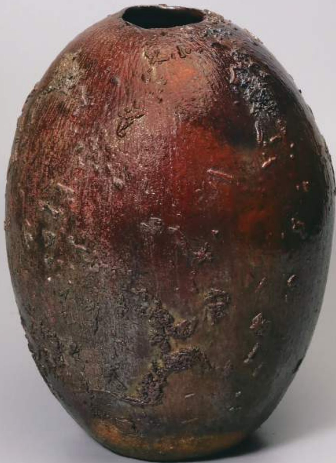
25 大樋窯変花入 24.3cmW×33.1cmH Firing-Denatured Obi Flower Vase