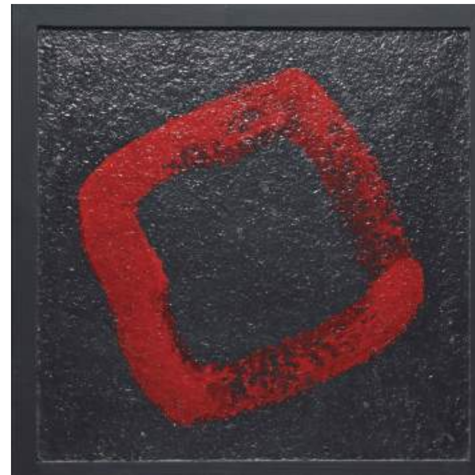
26 Black & Red 金沢浅野川砂、能登珪藻土、大樋土、漆喰、稻穂 45.0cmW×45.5cmW×2.5cm Sand of Kanazawa Asanogawa River, Noto Diatomaceous earth, Ohi Clay, Plaster and ear of rice