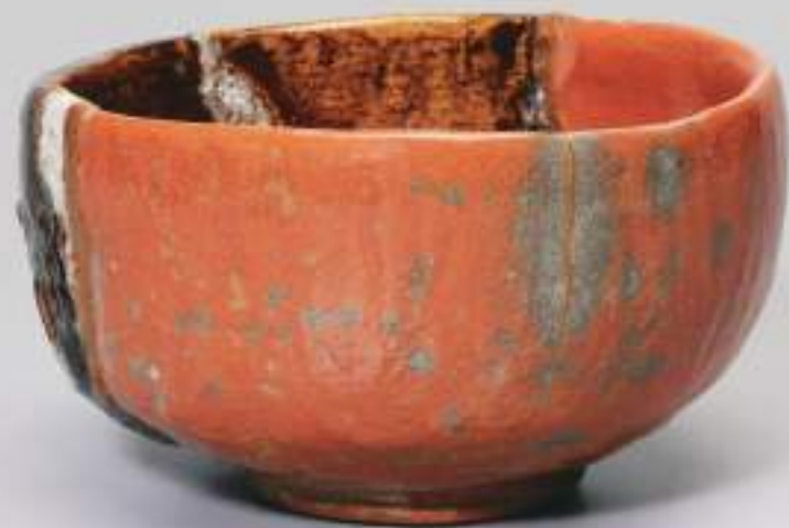
背面 (back side)

The Japanese believe there is a spirit that lies hidden within words. This spirit resides in the very land upon which we walk and places we inhabit. Each person possesses their own spirit, which is renewed time and time again.