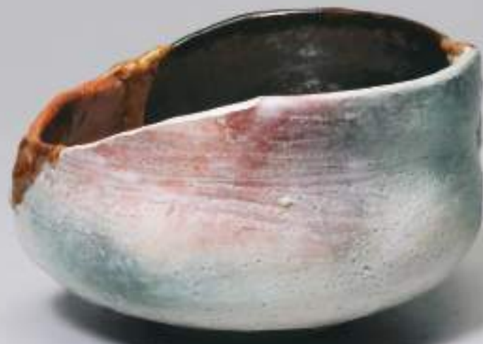
背面 (back side)

Tsuchidama-Earth Soul Solo Exhibition Toshio Ohi Chozaemon XI