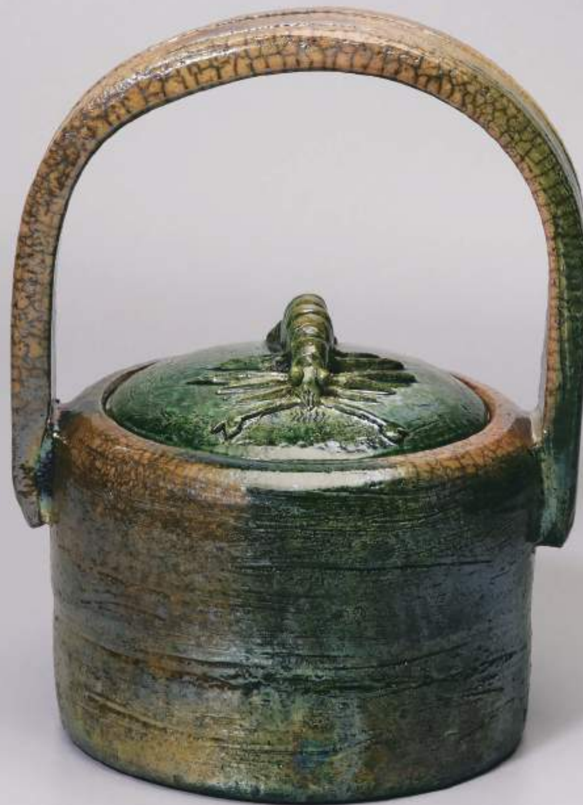
7 大樋窯変海老摘手水指 18.3cmW×26.7cmH Firing-Denatured Ohi Water Container with Prawn Shape Holder