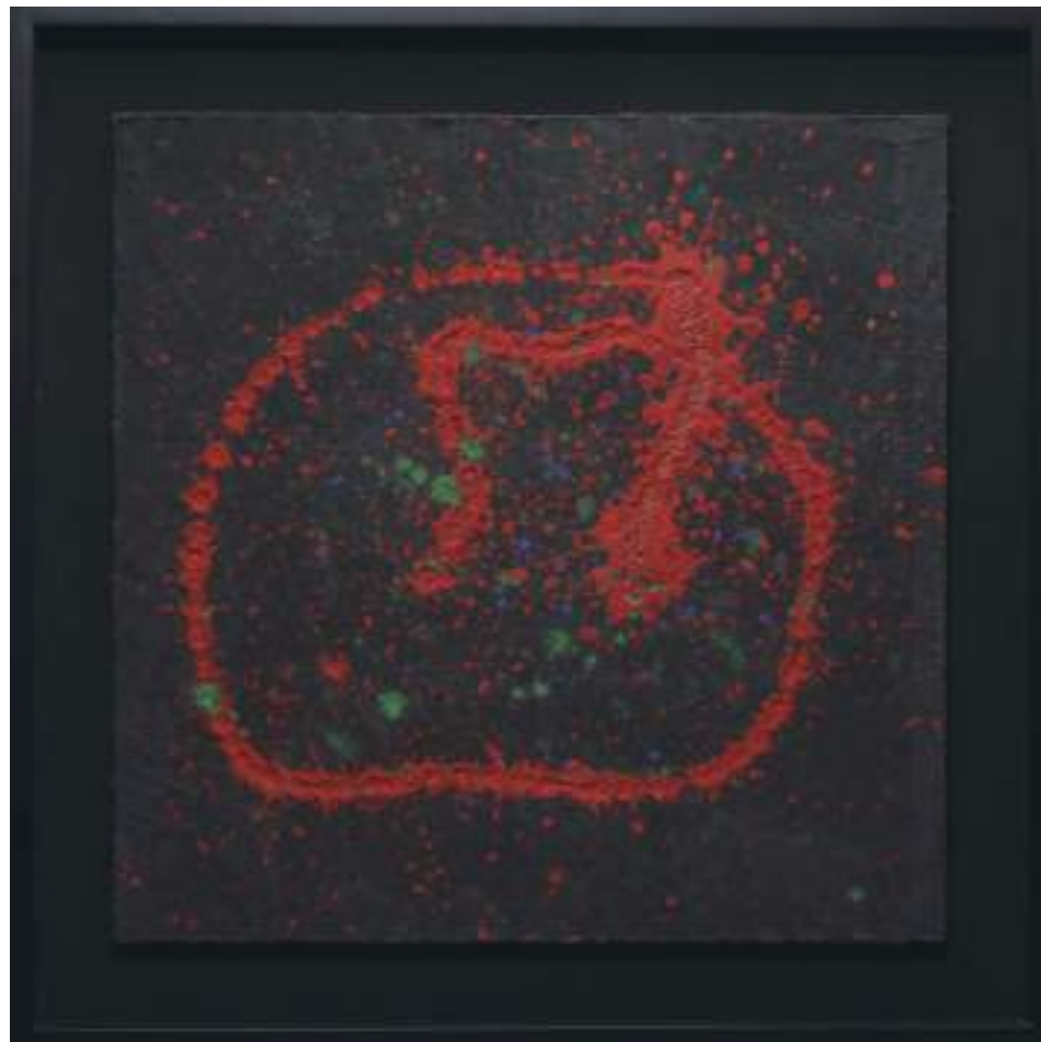
30 宙 金沢浅野川砂、能登珪藻土、大樋土、漆喰、稲穂 57.6cmW×57.7cmW×4.5cm Outer Space Sand of Kanazawa Asanogawa River, Noto Diatomaceous earth, Obi Clay, Plaster and ear of rice