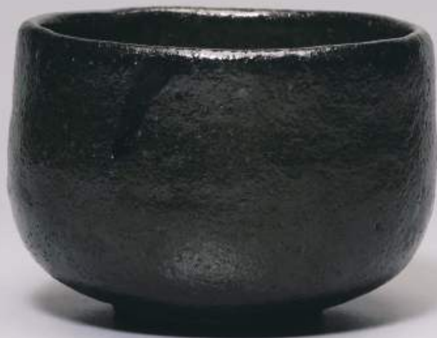
9 大樋黒釉茶盃 11.7cmW×8.1cmH Black Ohi Tea Bowl