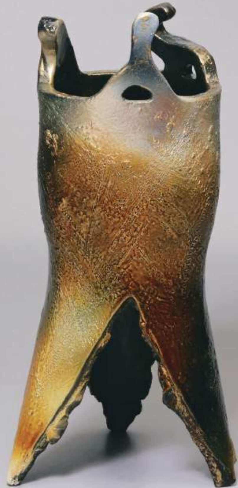
22 大槌窯変祭器 17.0cmW×35.8cmH Obi Ceremonial Vessel